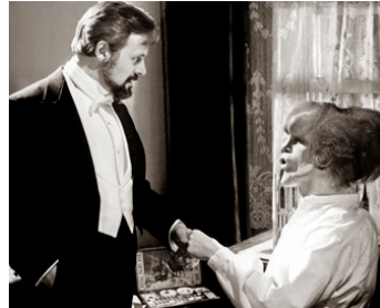
1980 ELEPHANT MAN (The Elephant Man) de David Lynch avec Anthony Hopkins