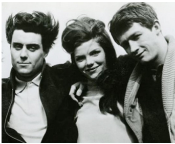
1962 THE WILD AND THE WILLING de Ralph Thomas avec Ian McShane, Samantha Eggar