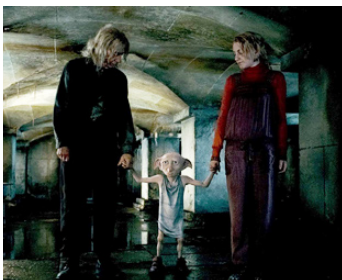
2010 HARRY POTTER ET LES RELIQUES DE LA MORT de David Yates avec Evanna Lynch