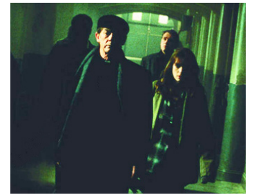
1999 LES ÂMES PERDUES (Lost Souls) de Janusz Kaminski avec Winona Ryder