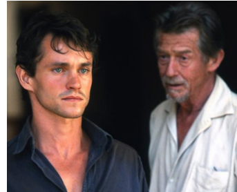
2004 SHOOTING DOGS (Beyond the Gates) de M. Caton-Jones avec Hugh Dancy