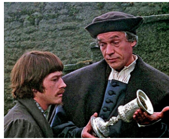
1966 UN HOMME POUR L'ÉTERNITÉ (A Man for all Seasons) de Fred Zinnemann avec Paul Scofield