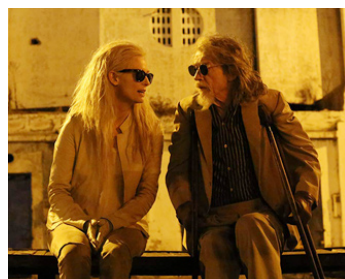
2012 ONLY LOVERS LEFT ALIVE de Jim Jarmush avec Tilda Swinton