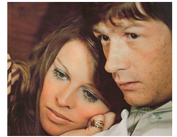
1969 À LA RECHERCHE DE GRÉGORY (In Search of Gregory) de Peter Wood avec Julie Christie