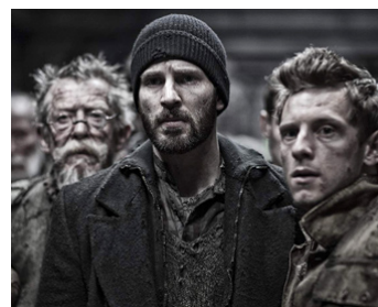
2013 LE TRANSPERCENEIGE (Snowpiercer) de Bong Joon-ho avec Chris Evans, Jamie Bell