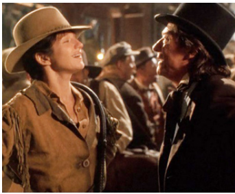
1995 WILD BILL (Wild Bill) de Walter Hill avec Ellen Barkin