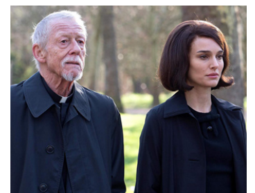
2016 JACKIE (Jackie) de Pablo Larrain avec Natalie Portman