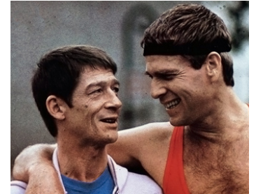
1981 LA CAGE AUX FLICS (Partners) de John Burrows avec Ryan O'Neal