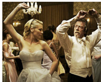
2010 MELANCHOLIA (Melancholia) de Lars von Trier avec Kirsten Dunst