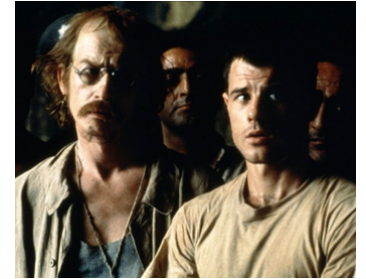
1977 MIDNIGHT EXPRESS (Midnight Express) d'Alan Parker avec Brad Davis