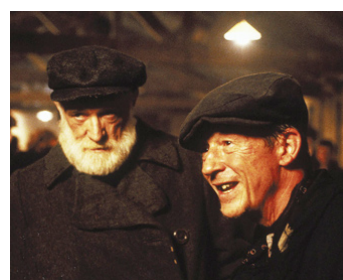
1990 THE FIELD (The Field) de Jim Sheridan avec Richard Harris