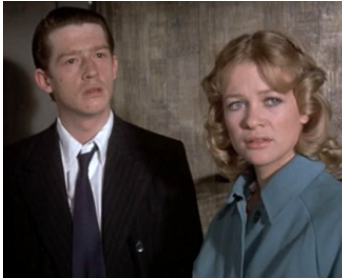
1970 L'ÉTRANGLEUR DE RELLINGTON PLACE (10 Rillington Place) de R. Fleischer avec Judy Geeson