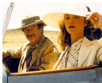
1986 SUR LA ROUTE DE NAIBORI (White Mischief) de Michael Radford avec Greta Scacchi