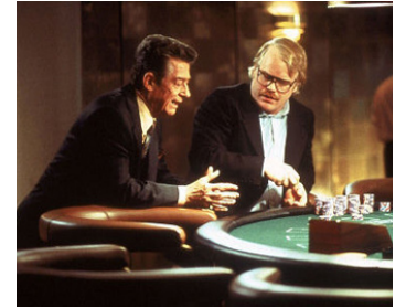
2002 MISTER CASH (Owning Mahowny) de Richard Kwietniowski avec Philip Seymour Hoffman