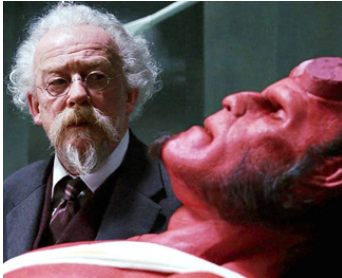
2003 HELLBOY (Hellboy) de Guillermo del Toro avec Ron Perlman