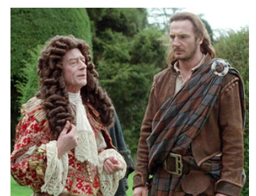
1995 ROB ROY (Rob Roy) de Michael Caton-Jones avec Liam Neeson