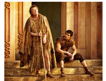
2011 LES IMMORTELS (Immortals) de Tarsem Singh avec Henry Cavill