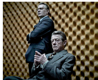
2011 LA TAUPE (Tinker Tailor Soldier Spy) de Tomas Alfredson avec Gary Oldman