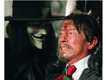
2005 V POUR VENDETTA (V for Vendetta) de James McTeigue avec Hugo Weaving