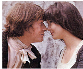
1968 DAVEY DES GRANDS CHEMINS (Sinful Davey) de John Huston avec Pamela Franklin