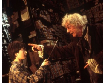
2000 HARRY POTTER À L'ÉCOLE DES SORCIERS de Chris Columbus avec Daniel Radcliffe