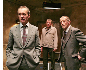
2009 44 INCH CHEST de Malcolm Venville avec Stephen Dillane, Tom Wilkinson