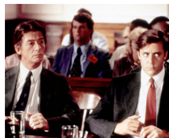
1986 FROM THE HIP (From the Hip) de Bob Clark avec Judd Nelson