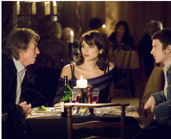
2007 CRIMES À OXFORD (The Oxford Murders) d'A. de La Iglesia avec Leonor Watling, Elijah Wood