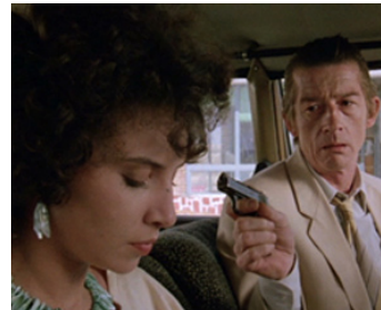
1983 LE TUEUR ÉTAIT PRESQUE PARFAIT (The Hit) de Stephen Frears avec Laura Del Sol