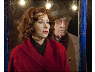
2009 BRIGHTON ROCK (Brighton Rock) de Rowan Joffe avec Helen Mirren