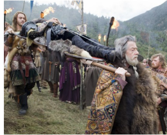
2007 OUTLANDER, LE DERNIER VIKING (Outlander) d'H. McCain avec Jack Huston