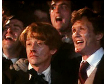
1979 LA PORTE DU PARADIS (Heaven's Gate) de Michael Cimino avec Kris Kristofferson