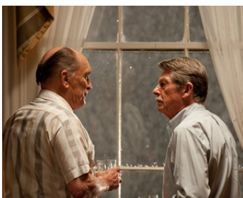
2012 JAYNE MANSFIELD'S CAR de Billy Bob Thornton avec Robert Duvall