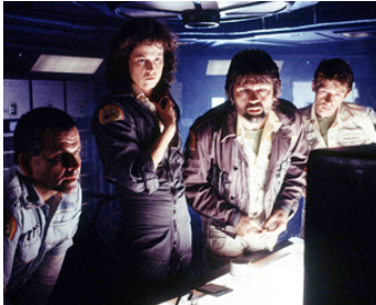
1978 ALIEN, LE 8 e PASSAGER (Alien) de R. Scott avec Ian Holm, Sigourney Weaver, Tom Skerritt