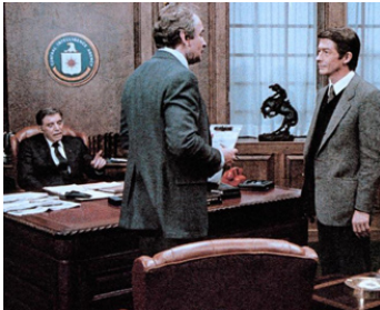
1983 LE WEEK-END OSTERMAN (The Osterman Week-end) de S. Peckinpah avec B. Lancaster