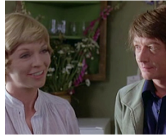
1977 LE CRI DU SORCIER (The Shout) de Jerzy Skolimowski avec Susannah York