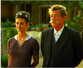
2000 CAPITAINE CORELLI (Captain Corelli's Mandolin) de John Madden avec Penelope Cruz