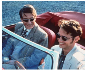
1996 AMOUR ET MORT À LONG ISLAND de Richard Kwietniowski avec Jason Priestley