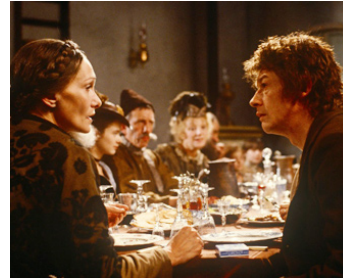
2001 CRIME ET CHÂTIMENT (Crime and Punishment) de Menahem Golan avec Vanessa Redgrave