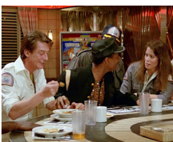
1987 LA FOLLE HISTOIRE DE L'ESPACE (Spaceballs) de Mel Brooks avec Denney Pierce, Camille Hagen